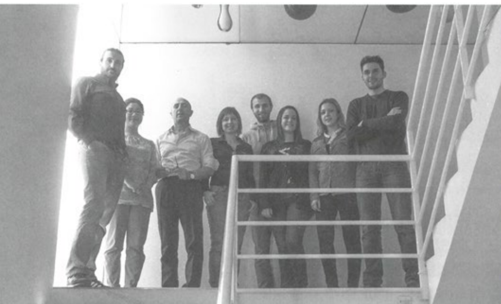
Lucchese Design Team