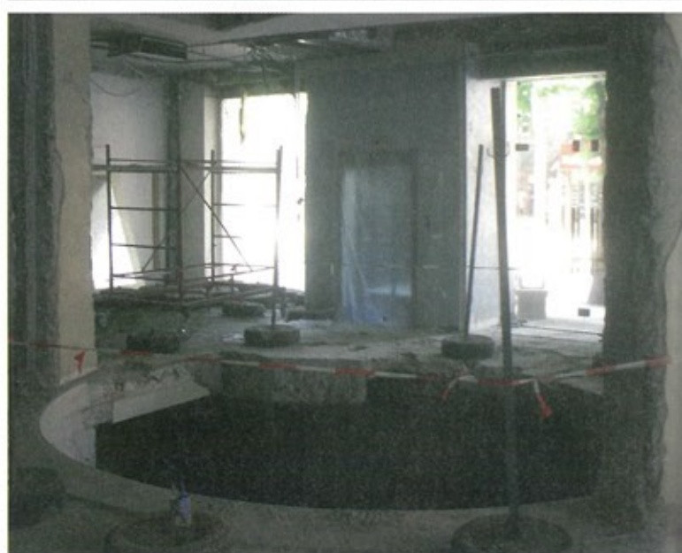
Hotel Les Fleurs (Sofia - Bulgaria) nato da un intervento di trasformazione di destinazione d'uso dell'Alexander Building, uno dei primi edifici moderni sorti nel centro storico di Sofia, sede di attività commerciali e terziarie distribuite nei suoi 8 piani fuoriterza e 2 interrati. Foto Arnaldo Dal Bosco Hotel Les Fleurs (Sofia - Bulgaria), un'immagine del cantiere interno. Foto Arnaldo Dal Bosco